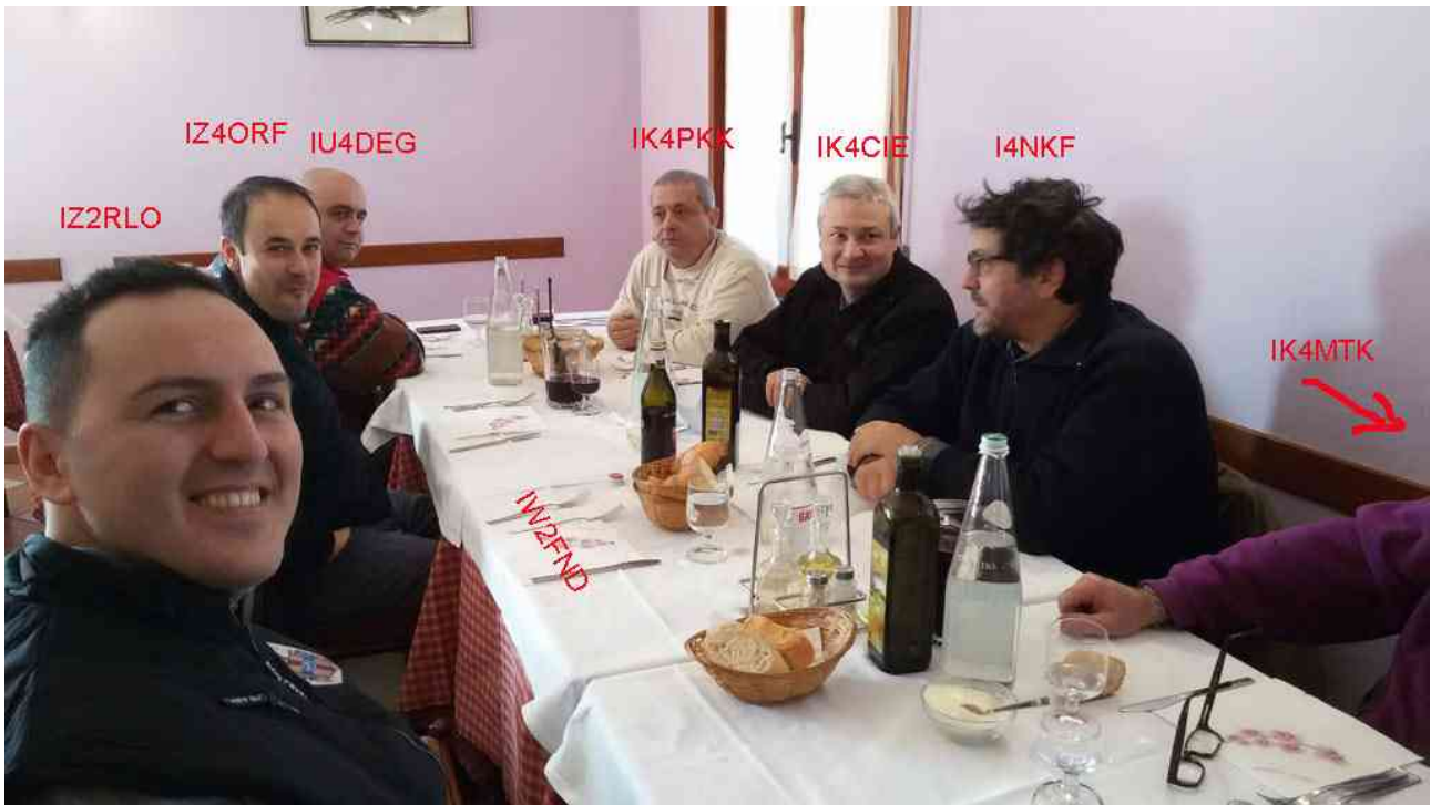
Immagine del pranzo

Dopo le operazioni di messa in punto si è potuto operare. Si sono fermati IK4CIE e IZ4ORF.