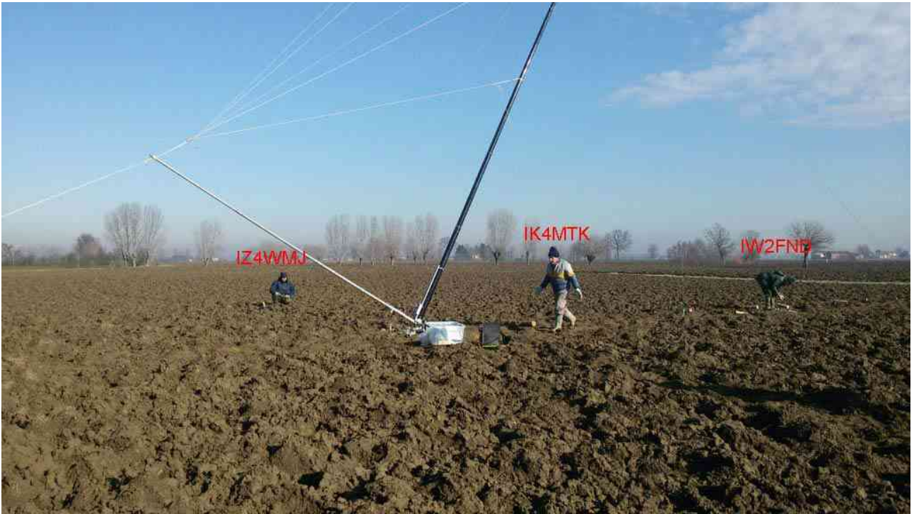
L'alzo della verticale TX