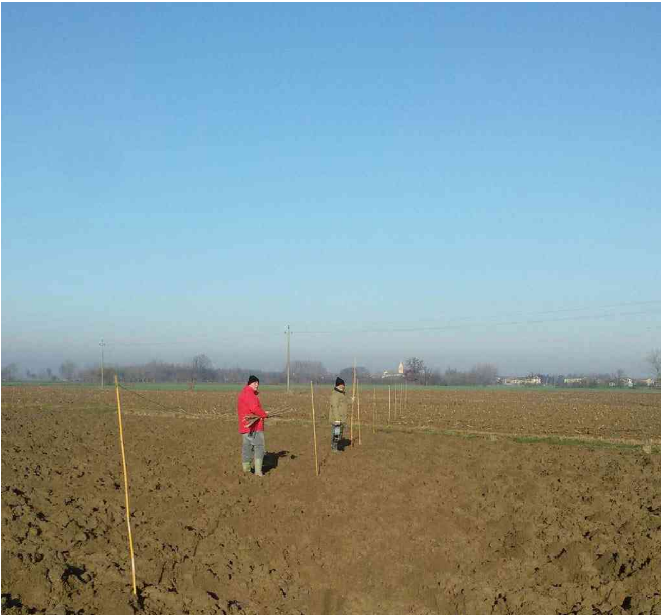
Una delle due Beverages

Dopo pranzo, organizzato da Cristiano IZ2RLO, sono continuate le operazioni di montaggio che sono terminate intorno alle 18 locali.