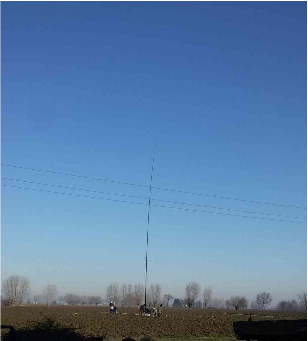
La verticale TX da 26m